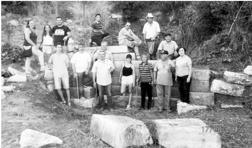
Στο ταφικό μνημείο στη θέση "Τουράκι"

τι που οδηγεί στο συγκεκριμένο μέρος -που είναι ο μόνος που το γνωρίζει- καθώς εκεί, κοντά στα εκατό μέτρα, είναι το πατρικό του σπίτι και τα χωράφια του.