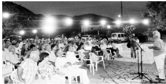
Ο Καθηγητής Αρχαιολογίας και Αντιπρόεδρος του Διαζώματος κ. Πέτρος Θέμελης στο θήμα

Με δύο πουλμανάκια του δήμου Ζαχάρως η προώθηση των καλεσμένων ως τις παρυφές του αρχαιολογικού χώρου Αίψυ. Και ύστερα οι ανηφόρες με εκατόν τόσα σκαλοπάτια, με αφόρητη ζέση που τη μετρίαζε το ολόδροσο νερό με τα εμφιαλωμένα μπουκαλάκια που μοίραζαν οι «οικοδεσπότες».