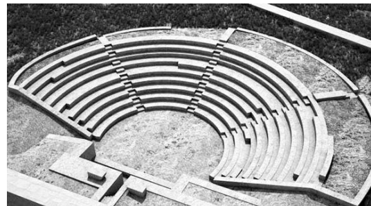
Το προτεινόμενο σχέδιο αναστήλωσης από την Εφορεία Αρχαιοτήτων Ηλείας που μελέτησε η κ. Μαρία Μαγνήσαλη

Η επιστημονική κοινότητα που «διαχειρίζεται» τον μνημειακό πλούτο οφείλει να επικοινωνήσει με δημιουργικό τρόπο με την υπόλοιπη κοινωνία της οποίας αποτελεί αναπόσπαστο τμήμα. Την ευκαιρία αυτής της επικοινωνίας την προσφέρουν ιδανικά τα αρχαία θέατρα που διαθέτουν αξιόλογη ακτινοβολία στις τοπικές κοινωνίες.